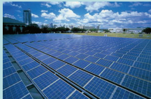
大阪市柴島浄水場 Kunijima Purification Plant